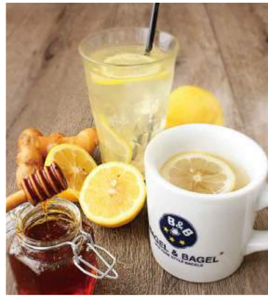
1930区 Bagel & Bagel 瀬戸内レモンのハニージンジャーレモネード ¥480