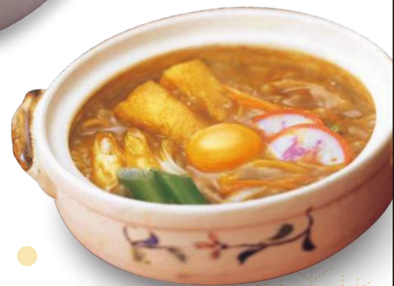
120区 若鯨家 カレー煮込うどん ¥1,120