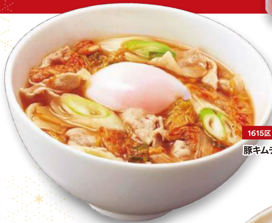
1615区 Nana's Green Tea 豚キムチうどん ¥972