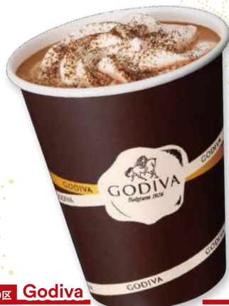
2000区 Godiva ホットショコリキサー ダークチョコレートカフェモカ ¥570