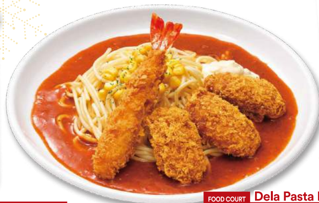
FOOD COURT Dela Pasta Kitchen カキフライとエビフライのあんかけスパ ¥1,100