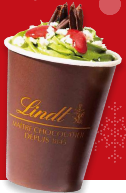
2440区 Lindt 抹茶ホットチョコレートドリンク ¥669