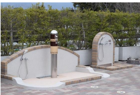
ペット向け衛生設備

Enjoy Shopping with Pets 特設ページ: https://www.premiumoutlets.co.jp/gotemba/pet/