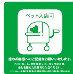
同伴入店可能店舗 識別ステッカー