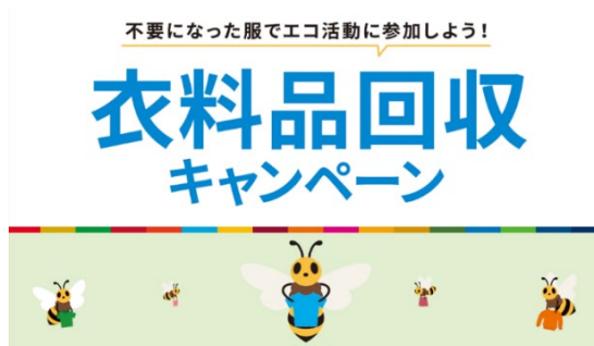
衣料品回収キャンペーン

三菱地所・サイモンでは、三菱地所グループの一員として、これまで、プレミアム・アウトレットを通じて、環境や社会課題に貢献する活動を行ってまいりましたが、今回の環境月間の制定も、サステナブルな社会の実現に向けた取り組みと位置付けています。