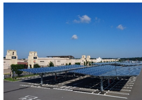
カーポート型太陽光発電設備（酒々井）