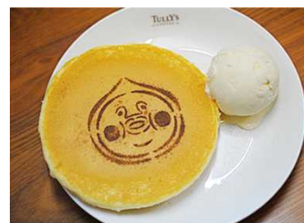
「こびとパンケーキ」(イメージ)