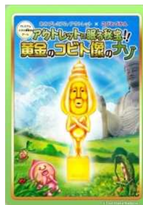
※限定カード(イメージ)