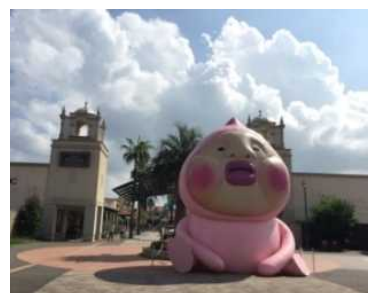
「カクレモモジリ」バルーン