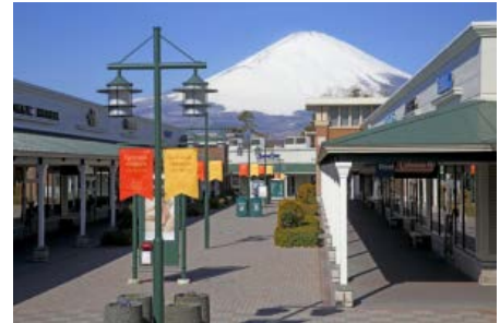
御殿場プレミアム・アウトレット

憧れの高級ブランドから人気のセレクトショップ、スポーツブランド、生活雑貨など、国内外のさまざまな有名ブランドが出店し、毎日お得なプライスでお買い物をお楽しみいただけるアウトレット。海外リゾートをイメージした非日常的な空間で、街並みを散策するようにショッピングをお楽しみいただけます。