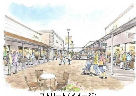
ストリート(イメージ)