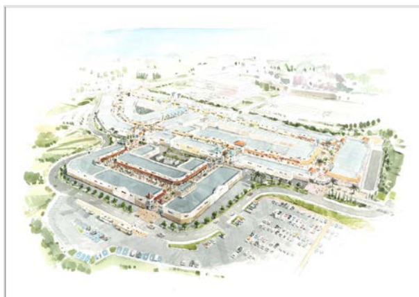
神戸三田プレミアム・アウトレット 第3期増設イメージ