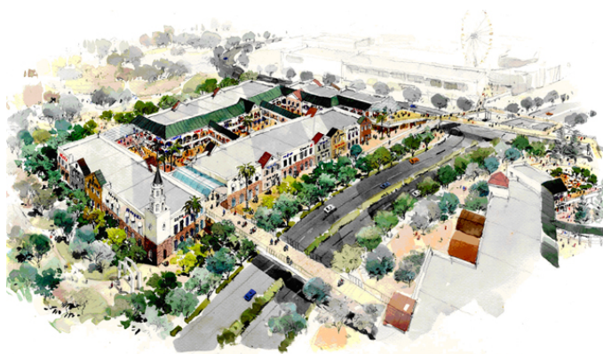
りんくうプレミアム・アウトレット 第4期増設イメージ